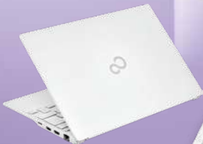
筐体色：シルバーホワイト